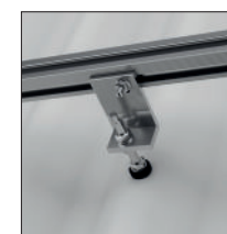
Bølget tagsten af metal