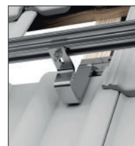
Dobbelte tagsten i panelsystem